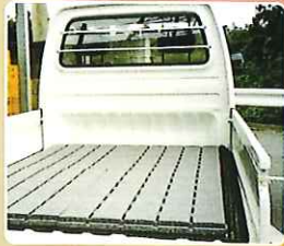
トラックの荷台 高い緩衝性で荷物を守ります