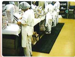
生協などのラインや スーパーのバックヤード