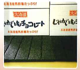
倉庫内の結露防止