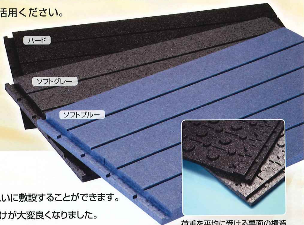
荷重を平均に受ける裏面の構造