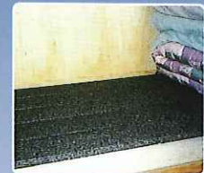
押入・タンスなど 加工性に優れたどんなスペースにもピッタリ