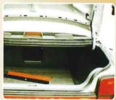
トランクの中敷 どんなトランクにもピッタリ加工できます