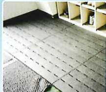
学校などの踊り場