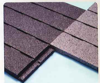
しっかり接合できるジョイント式