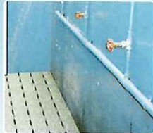
シャワー室 水切れも良く丈夫です