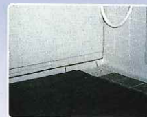
風呂場 表面がアーチ型なので水はけが良い