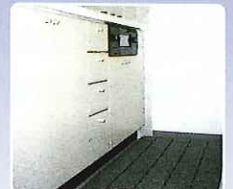
台所 丸洗いできるのていつも清潔